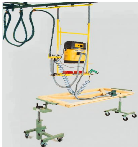
RU-GH-4DEW, 4 raccords d'air comprimé, 4 prises électriques. Avec tablette repose outils