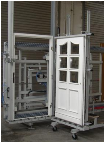
RU-HKS und RU-TKE

Haustüren-Montage- und Kontrollstation RU-HKS-83°/90° mit Kippstellung 83° und 90° und Vorrichtung zur Montage von Verpackungsbrettern. Ein Pressbalken (wahlweise links oder rechts) abklappbar, zweiter Pressbalken manuell verfahrbar, oben und unten über Zahnstangen geführt, dadurch paralleler Pressdruck beim Verpressen. Spannbalkenhöhe 2400 mm, Spannbereich 300 – 3000 mm, Pneumatische Kippeinrichtung mit vertikaler Kippstellung bei 83° und 90°. Einhängevorrichtung bestehend aus Hubeinrichtung 200 mm. Stufenlose Höheneinstellung erfolgt über ein drehbares Handventil.